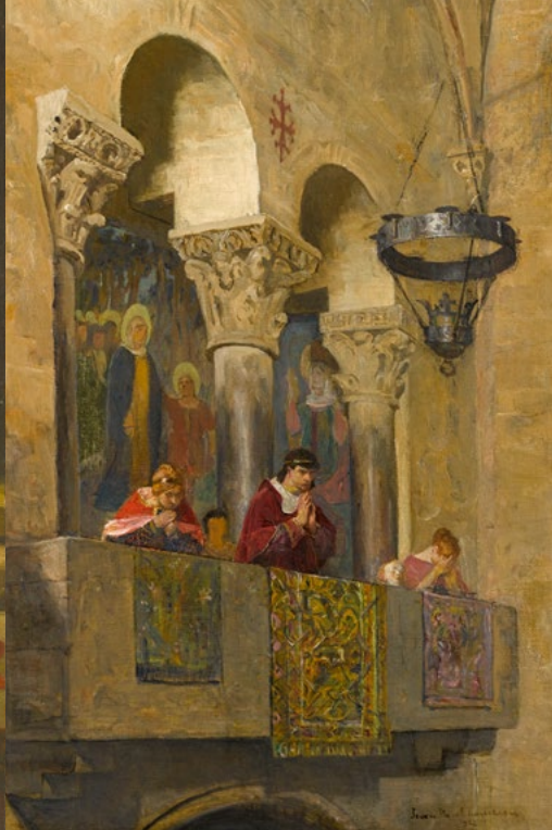
Jean-Paul LAURENS, Le comte de Toulouse Raymond VI en prière dans une église © RMN-Grand Palais (MUDO-Musée de l'Oise) / René-Gabriel Ojéda.