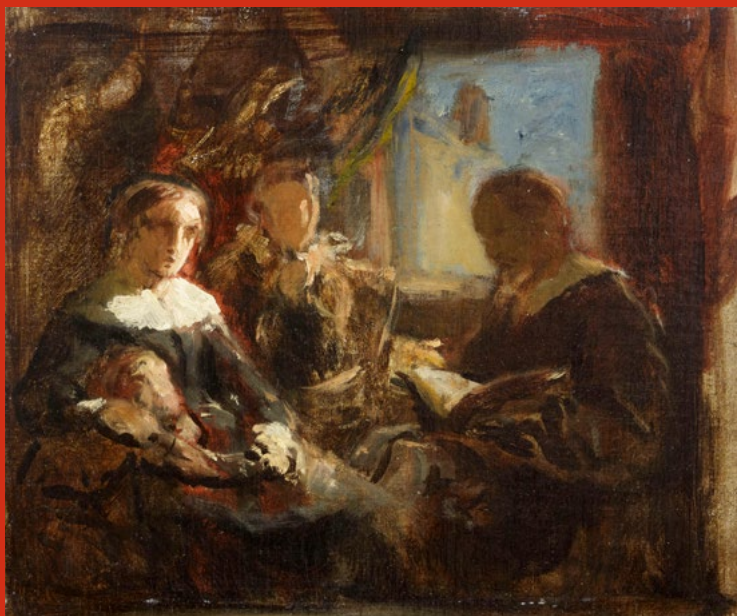
Charles-Louis MÜLLER, La lecture de la Bible (esquisse), vers 1850, huile sur toile © RMN-Grand Palais (MUDO-Musée de l'Oise) / Thierry Ollivier.

E nrichir les collections est l'une des obligations légales des musées, telles que le Code du patrimoine les définit. Retrouvez ici un bref aperçu de quelques récentes acquisitions du MUDO-Musée de l'Oise, à découvrir prochainement dans nos expositions.