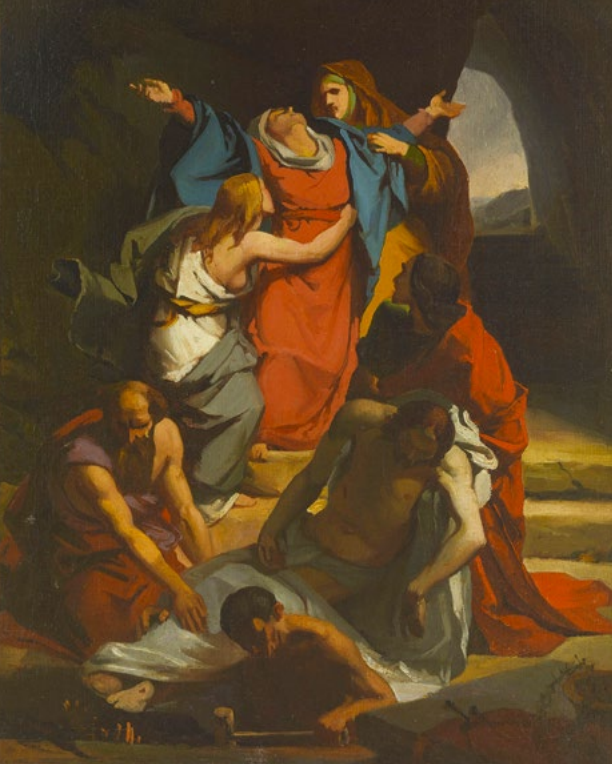
Nicolas HESSE, L'évanouissement de la Vierge