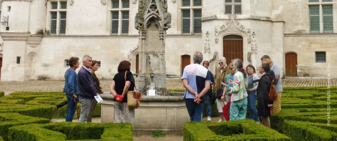
Phil'o MUDO