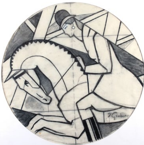
Jacques GRUBER, L'équitation © RMN-Grand Palais (MUDO-Musée de l'Oise) / Jean-Louis Bouché.