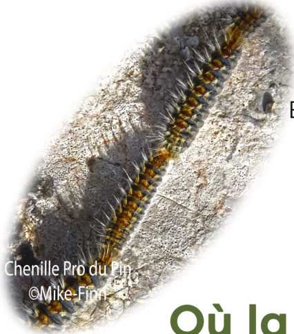
Chenille Pro du Pin